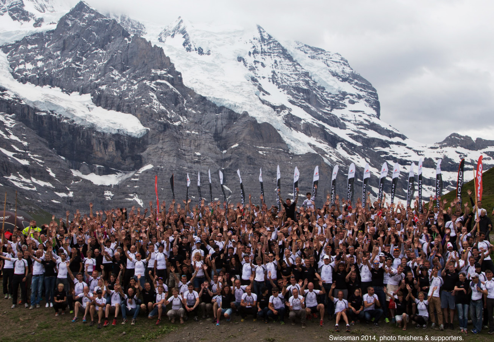
Swissman 2014, photo finishers & supporters.