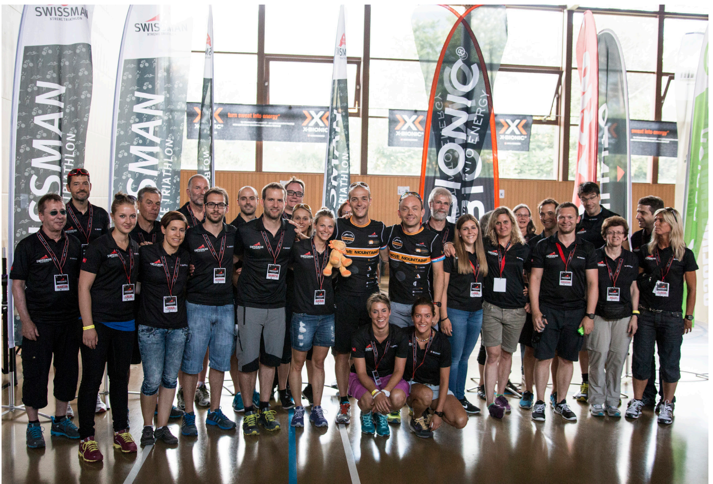
La famille "Swissman".